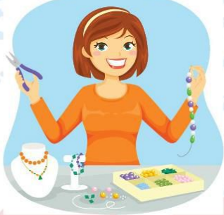
goldsmith โกลด์สมิธ ช่างทอง