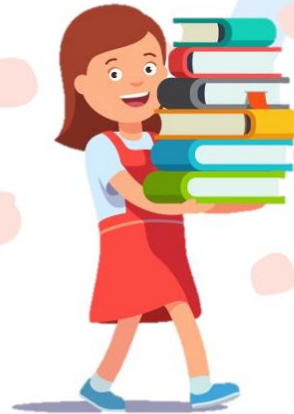
bookseller บุคเชลเลอร์ คนขายหนังสือ