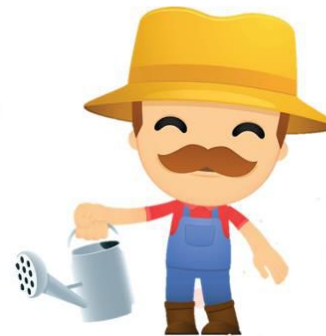
gardener การ์เดินเฮนอะ ชาวสวน