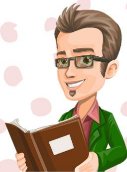
author ออธอร์ นักประพันธ์