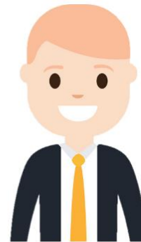
marketer มาร์เก็ตเตอร์ นักการตลาด