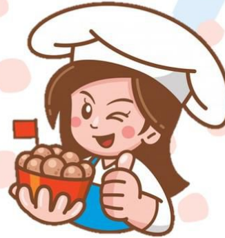
gourmet กัวเม นักชิมอาหาร