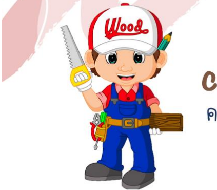
carpenter คาร์เพนเทอะ ช่างไม้