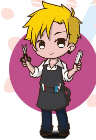
stylist ส้ทลล้ซท น้กตกต้ตง