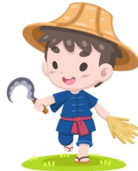
farmer ฟาร์มเมอะ ซาวนา