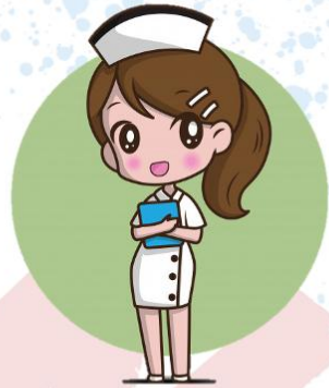
nurse นั้ร้ซุ นางพยาบาล