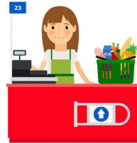
cashier แคชเชียร์ พนักงานรับจ่ายเงิน