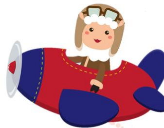
aviator เอวีเอเตอร์ กัปตันเครื่องบิน