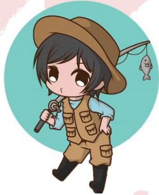
fisherman ฟิชเชอะเมิน ชาวประมง