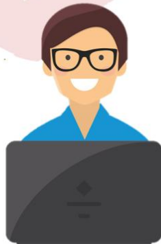
adman แอดแมน นักโฆษณา