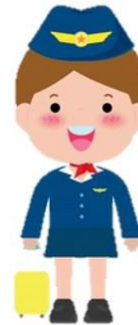
flight attendant ไฟลท แอ็ทเทน-แต็นท พนักงานต้อนรับบนเครื่องบิน