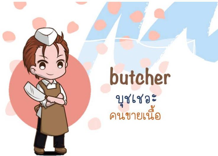
butcher บุชเชอะ คนขายเนื้อ