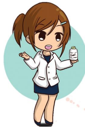
chemist เคมีสท์ นักเคมี