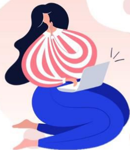
freelancer ฟรีแลนเชอะ คนทำงานอิสระ