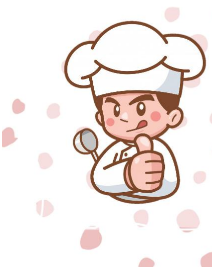
chef เชฟ หัวหน้าพ่อครัว