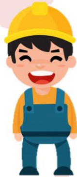
engineer เอนจ้นเ้ยร้ ว้ศวกร