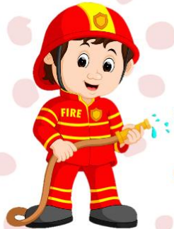
firefighter ไฟเออะไฟทเออะ พน้กงานด้บเพลิง