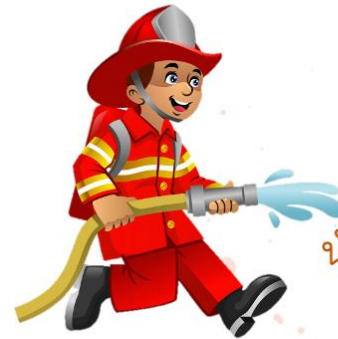
fireman ไฟเออะเม้ช น้กด้บเพลิง[ซาย]